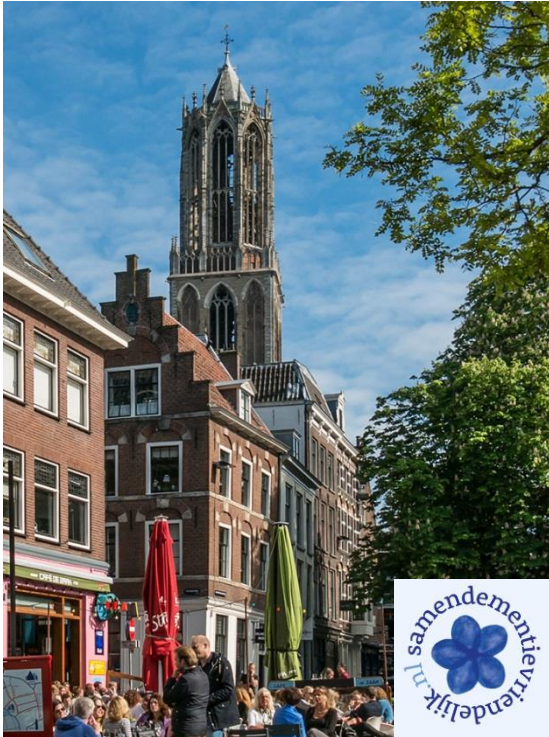
Midden in het leven