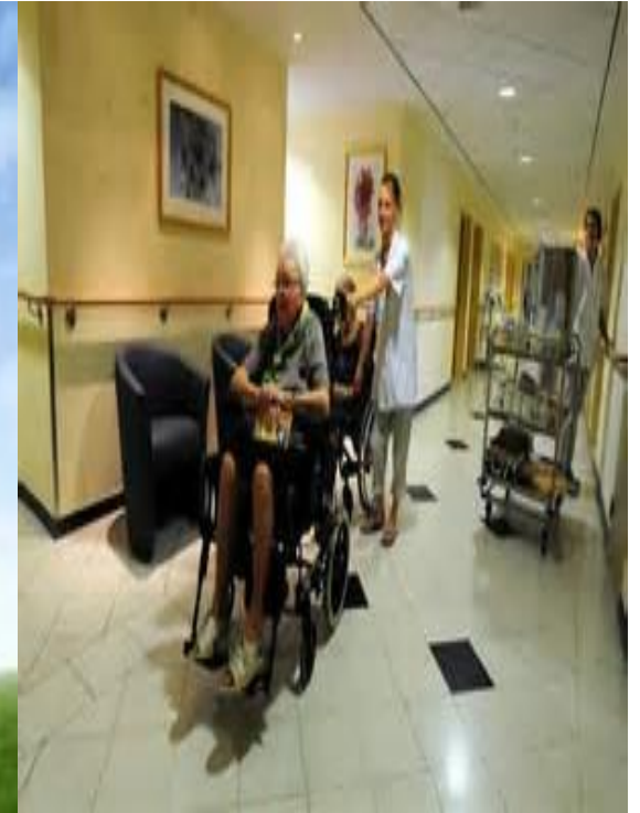
Afhankelijkheid van zorg en beslissingen