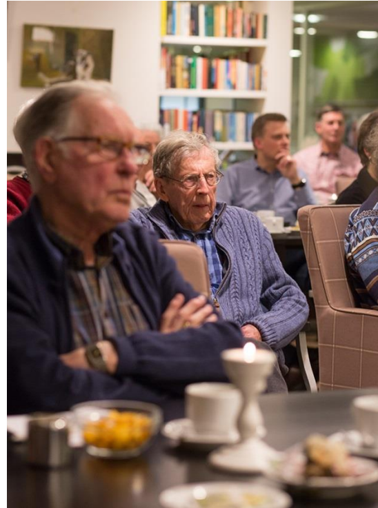
Rondom diagnose dementie