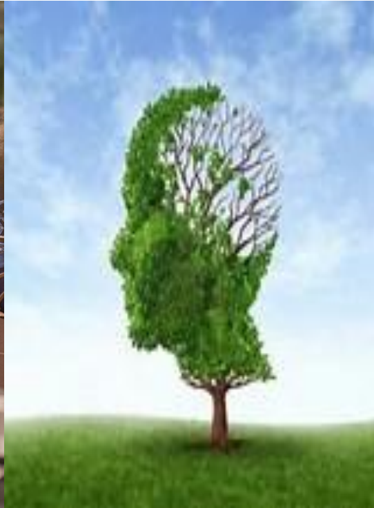
Periode van (naderende) wilsonbekwaamheid